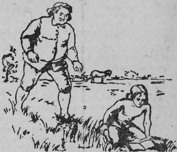
Ис. Ньютон аскас пощӧс бокын лыддӧ нига

да велӧдчӧ. Уж помалӧм бӧрын джек лок- тас аптекар ордӧ, оз-кӧ сее адчы Исаакс, сijӧ тӧдӧ-нин, — вескыда локтас Исаак куж- ланinӧ.