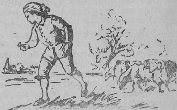
Исаак Нјутон ыжјас дөчөрітө.

— Решіті, решіті, — рад сөлөмөн гөрдөдіс Исаак да сајаліс көркаө.